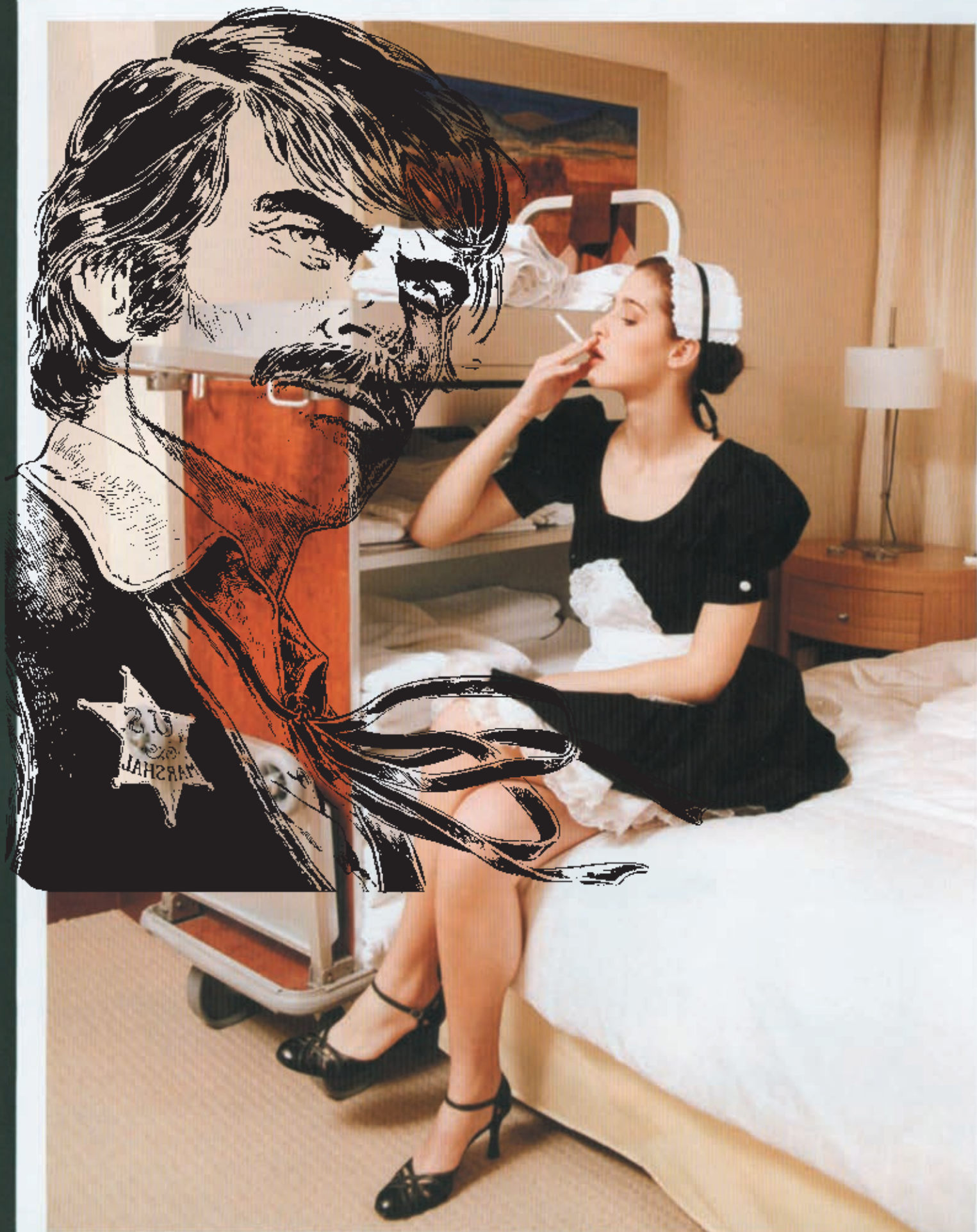
Manchmal, wenn sie schnell gewesen sind, gönnen sich Zimmermädchen ein Pause in einem der leeren Zimmer.