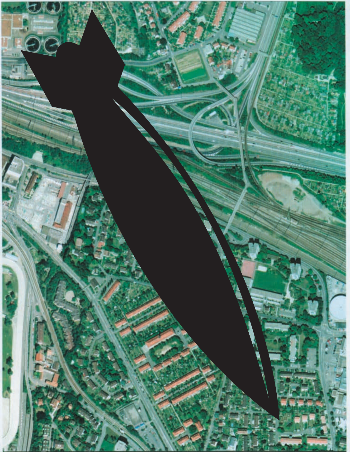
Mehr Urbanität: Basel-Ost