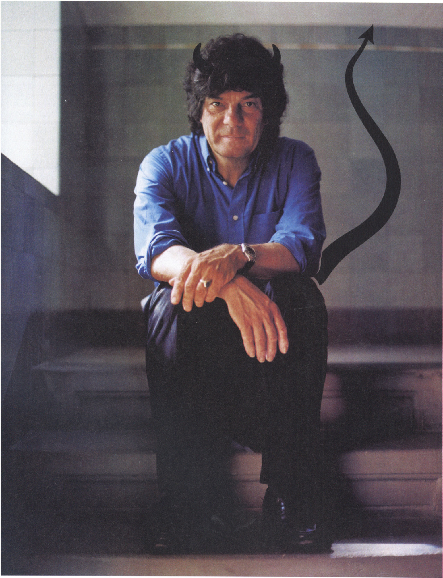
Jugendliche haben ein Recht, nicht verstanden zu werden»: Allan Guggenbühl, Jahrgang 1952.