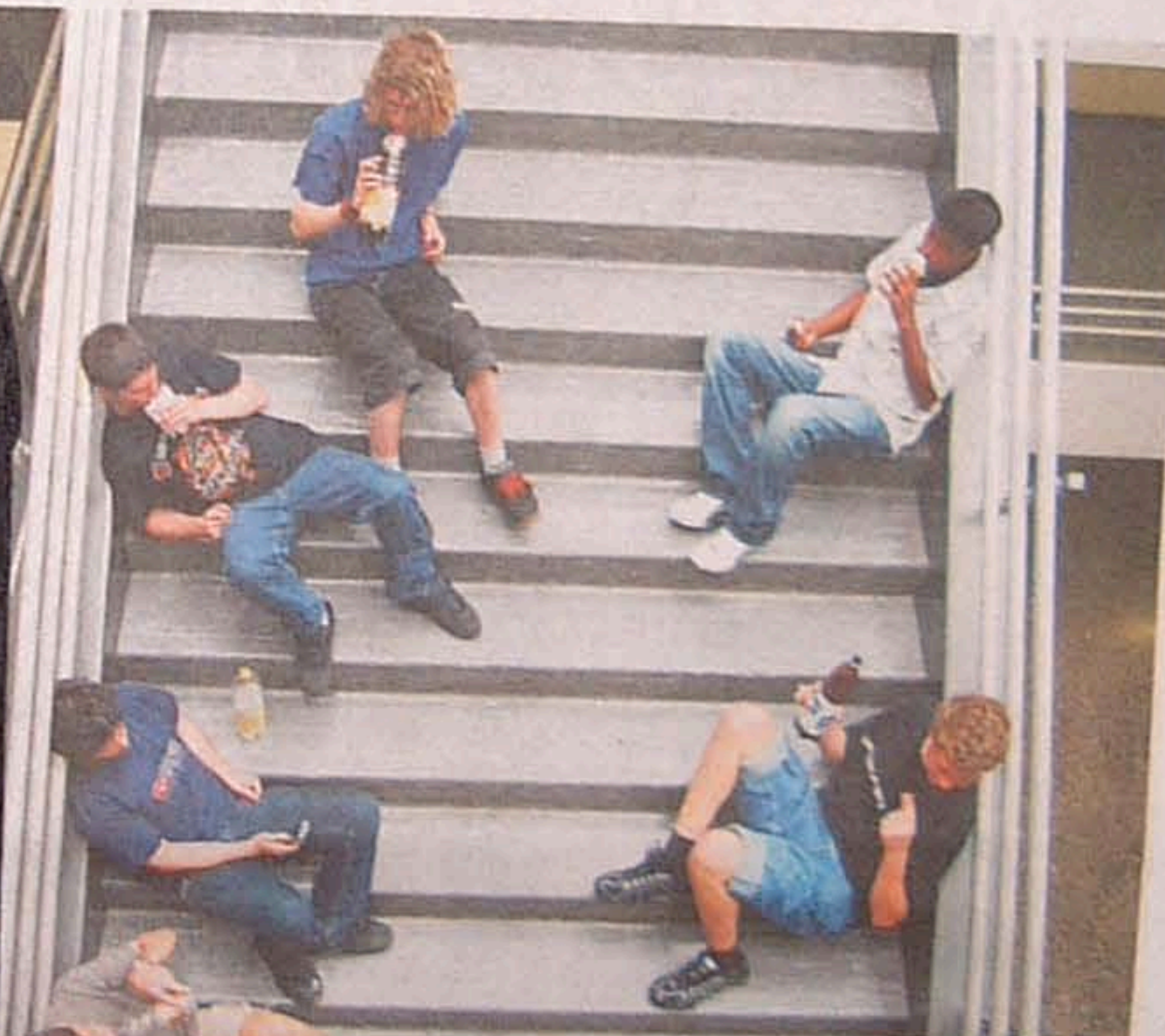
ate Aussichten auf eine feste Stelle: Berufsschüler in Dietikon während einer Pause.

zusätzliche Stelle schaffen könnten, um auch Lehrabgängern eine Chance zu geben». Immerhin hätten die Arbeitgeber erkannt, dass etwas getan werden müsse, sagt Ralf Margreiter. Es gelte auf jeden Fall zu verhindern, «dass der Aufschwung an den Jugendlichen einfach vorbeigeht». Dabei stünden besonders jene Betriebe in der Pflicht, die selber keine Lehrlinge ausbildeten, schreibt KV Schweiz. Diese sollten sich wenigstens daran beteiligen, junge Erwachsene in die Arbeitswelt zu integrieren. * Name geändert