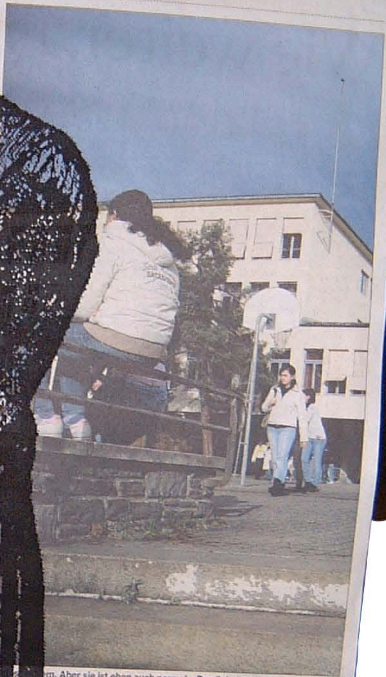
Aber sie ist eben auch normal.» Das Schulhaus Buhrain in Zürich

Endstation: Zürich Seebach. Der Tramchauffeur bittet alle auszusteigen. Das Quartier im Zürcher Kreis 11 hat 20 000 Einwohner, 34 Prozent Ausländer und eine steigende Anzahl Gewaltdelikte. Mal ist es ein Raub. Mal ein Diebstahl. Vor zwei Wochen war es die mehrfache Vergewaltigung eines 13-jährigen Mädchens.