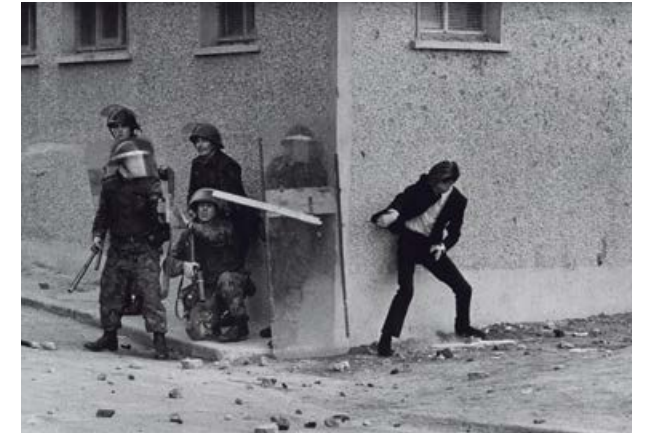
The Bogside, Londonderry, Northern Ireland 1971